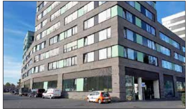
Zicht op Crescendo vanuit de Hamelstraat

In deze coronatijd gaat dat nét even anders. Om de bewoners te beschermen, konden er geen bezoekers en vrijwilligers meer komen. De bruisende daginvulling viel weg. Maar gelukkig verbindt corona ook! Dat zien we aan de vele initiatieven van