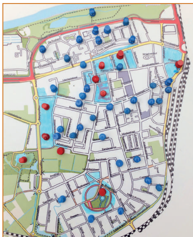
Blauwe pins zijn actieve bewoners Rode pins zijn actieve partners

We hebben al veel bereikt, maar we zijn er nog niet. Wij blijven op zoek gaan naar bewoners en grotere partners die ons willen helpen.