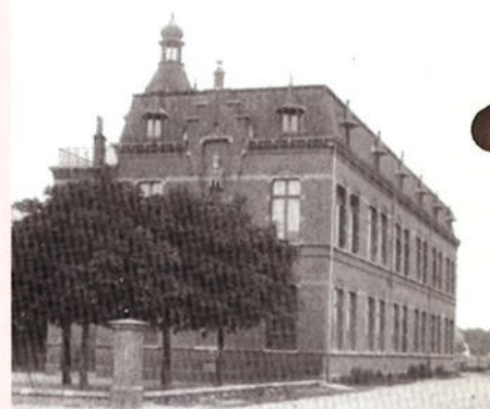
Meisjesschool Tegelseweg in 1908