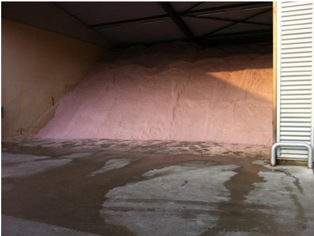
Figuur 1 - Zoutopslag Hulsterweg

Het dooimiddel (zout) wordt opgeslagen in de zoutloods op het terrein van de Buitendienst aan de Hulsterweg. Bij aanvang van het winterseizoen is de zoutloods gevuld met 650 ton zout, goed voor ongeveer 20 complete strooiroutes waarbij maximaal 14 gram per m 2 wordt gestrooid. In de zomerperiode wordt de zoutopslag weer gevuld.