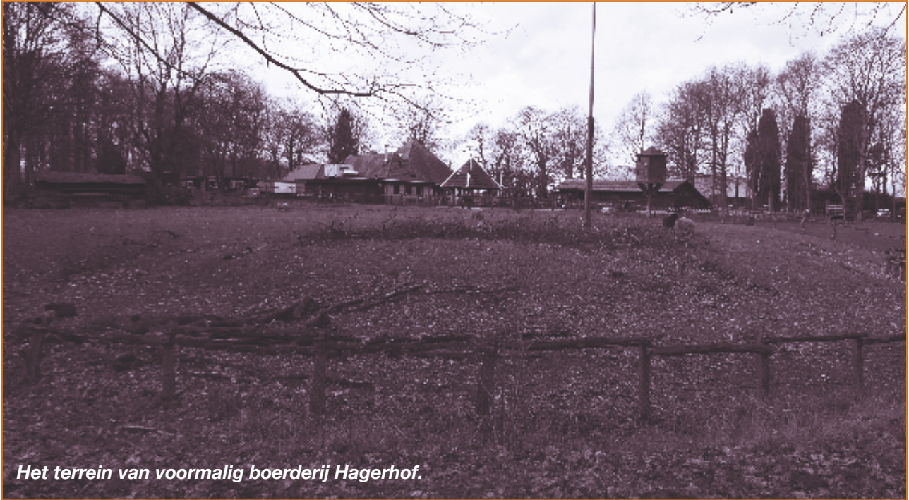
Het terrein van voormalig boerderij Hagerhof.

Toen ik nog een klein jochie was ging ik vaker met mijn ouders en mijn broer van oma en opa die in de Willemstraat woonden naar mijn oom en tante op de Vierpaardjes. We liepen dan niet door een woonwijk, maar door agrarisch gebied.