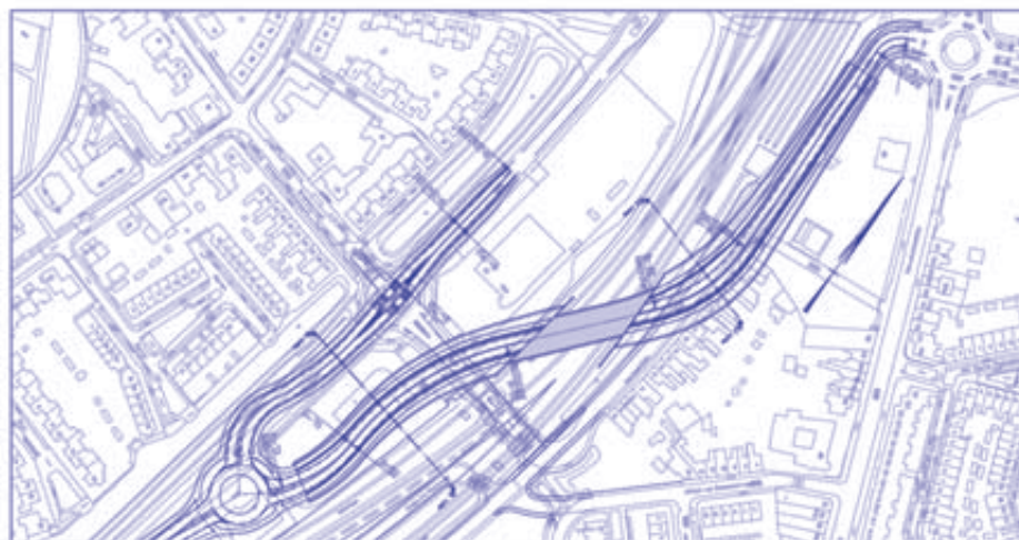
Figuur 11 Westvariant Guliksebaan met schuine tunnel Vierpaardjes

Er is een akkoord over de ondertunneling en dat is goed nieuws voor de veiligheid. Maar er zijn toch nog wat vragen over de exacte inrichting en de situatie tijdens de werkzaamheden. Bijvoorbeeld hoe staat het met de oversteek van fietsers en voetgangers. Veel scholieren maken gebruik van de huidige oversteek. Vanuit Venlo-Zuid heb ik interesse om het belang van een goede veiligheid en bereikbaarheid in de gaten te houden. Ik doe een oproep aan bewoners van Venlo-Zuid om zich aan te melden om met mij een klankbordgroep te vormen en de aanpak kritisch mee te volgen. Zij kunnen zich melden bij bewonersnetwerkvenlozuid@hotmail.com met vermelding interesse voortgang Vierpaardjes en worden dan op de hoogte gehouden over een te vormen klankbordgroep Venlo-Zuid.