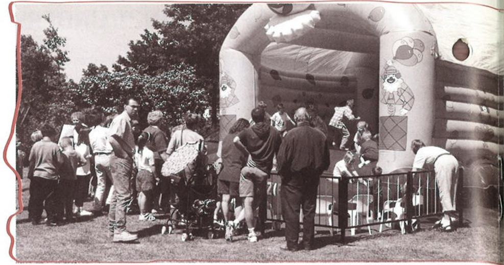
Een luchtkussen voor de jongste generatie

De themagroepen krijgen regelmatig verzoeken van inwoners van Venlo-Zuid om actie te ondernemen tegen overlast, straatvuil, onveilige verkeerssituaties e.d. Meestal worden deze klachten doorgespeeld aan de gemeente en dan kan het gebeuren dat wij géén goed overzicht meer hebben wat er nu precies wel en niet goed is afgehandeld. U moet daarom beslist opnieuw met ons contact opnemen, als u vindt dat er onvoldoende aandacht aan uw opmerkingen is geschonken. Alléén dan heeft onze inzet echt succes.