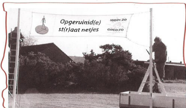
Eén van de vele spandoeken.

Foto's spreken voor zich. Daarvan op deze pagina's een achttal impressies van de Milieudag die op 31 mei j.l. in Venlo-Zuid heeft plaatsgevonden.