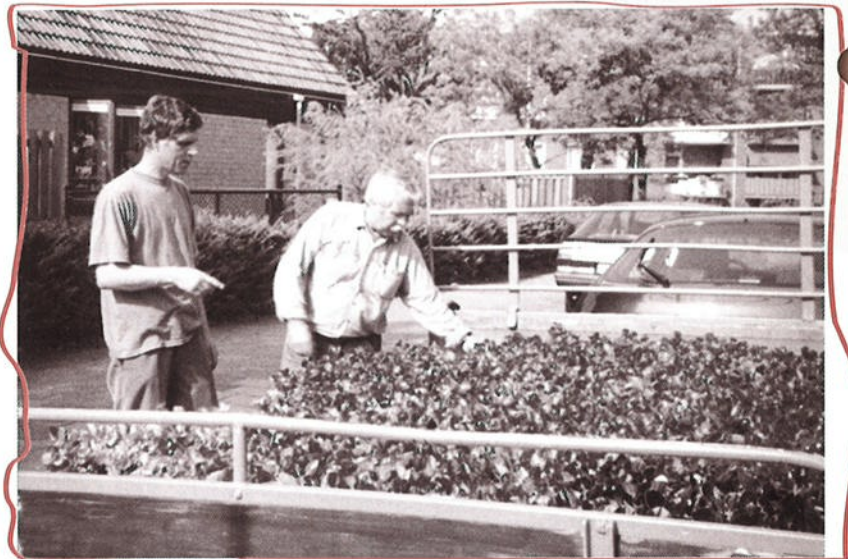
Vlijtig tussen zijn 'liesjes'.

Wijkkrant nr. 6 verschijnt in de laatste week van september. Kopie voor deze uitgave dient uiterlijk 7 september in het bezit te zijn van de redactie.