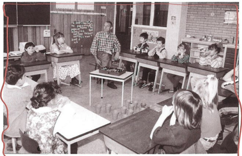
Op school was het milieu gesprek van de dag.