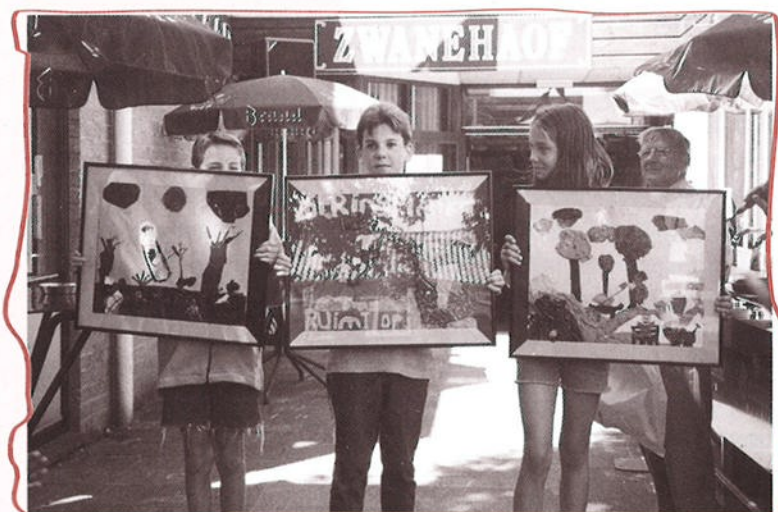
Trots poseren voor de fotograaf!