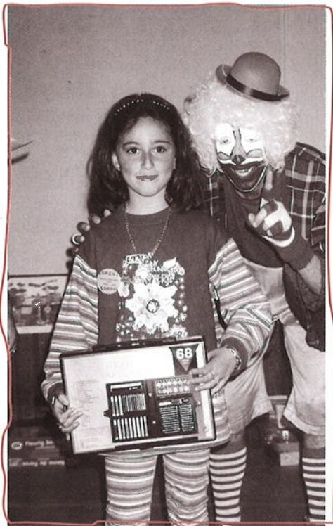
Samen met de clown lachen naar het vogeltje.