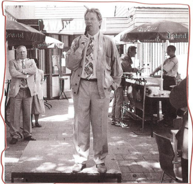
Als de Wethouder spreekt...