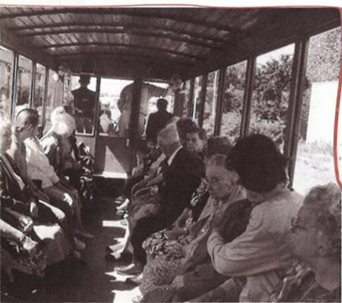
De senioren een nostalgische paardentram.