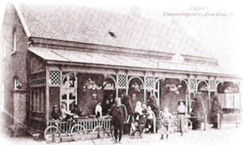
Halfweg Tegelen-Venlo ligt sinds 1706 de herberg "De Drie Kronen"

Een tijdje geleden hoorde ik op straat toevallig enkele kinderen met elkaar praten. Een van hen zei: "ich hōb niej sjoon aan". "Sjoon? Schoon móste zegge" zei een ander. Het bleek dat het eerste kind Tegelse ouders had, maar wel in Venlo woonde.