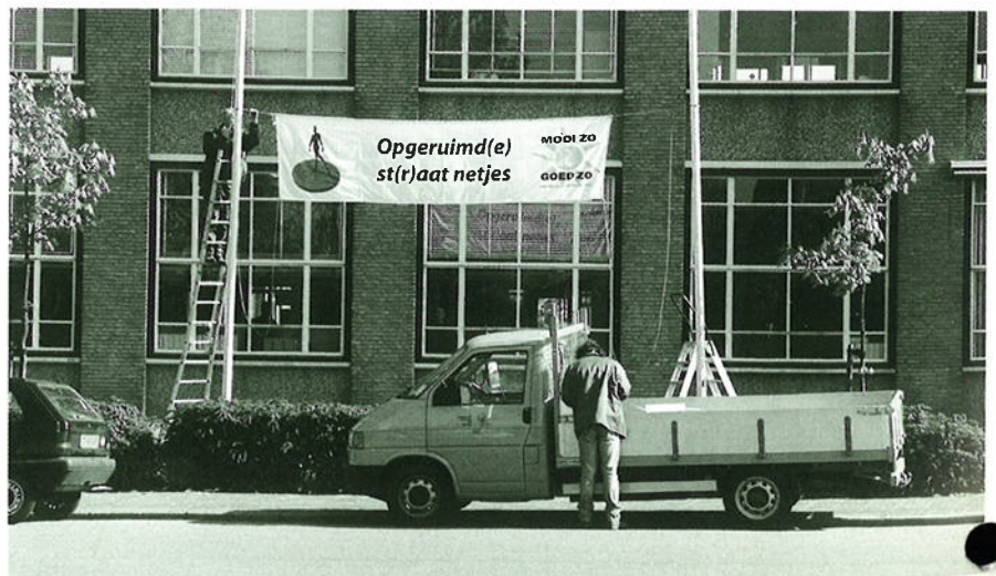
Het ophangen van een spandoek bij het Gelre College.